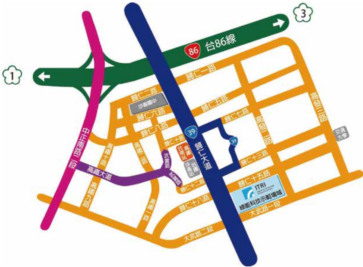
往工研院沙崙辦公室路線圖